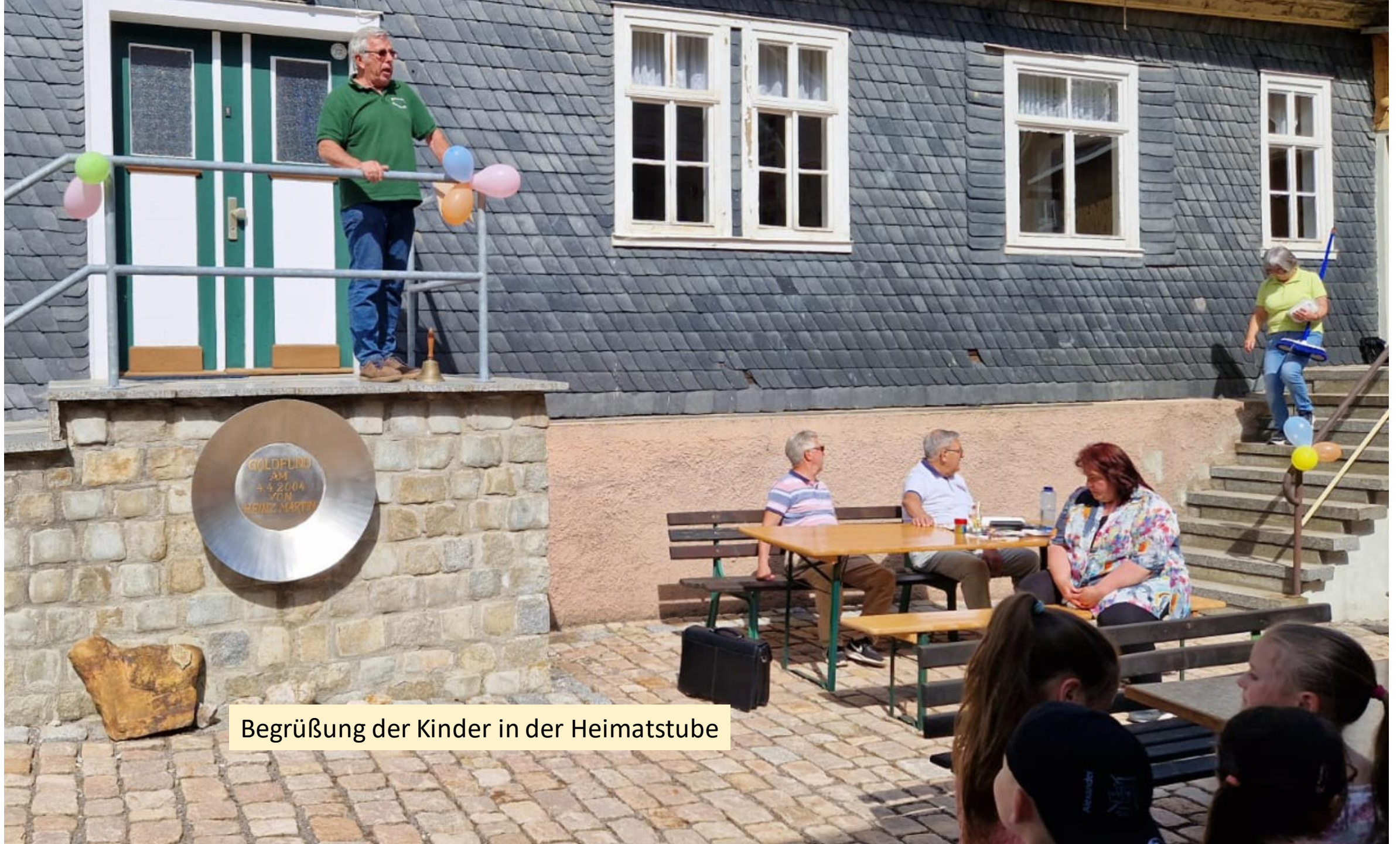
Begrüßung der Kinder in der Heimatstube