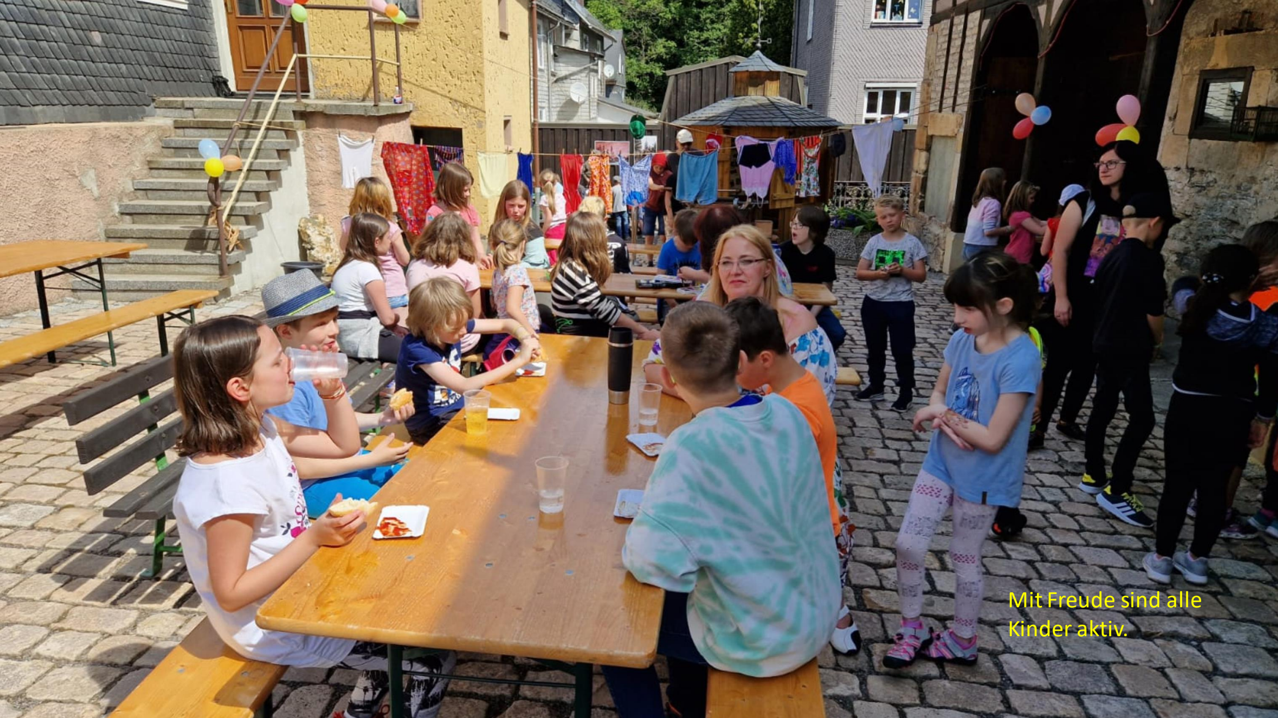
Mit Freude sind alle Kinder aktiv.