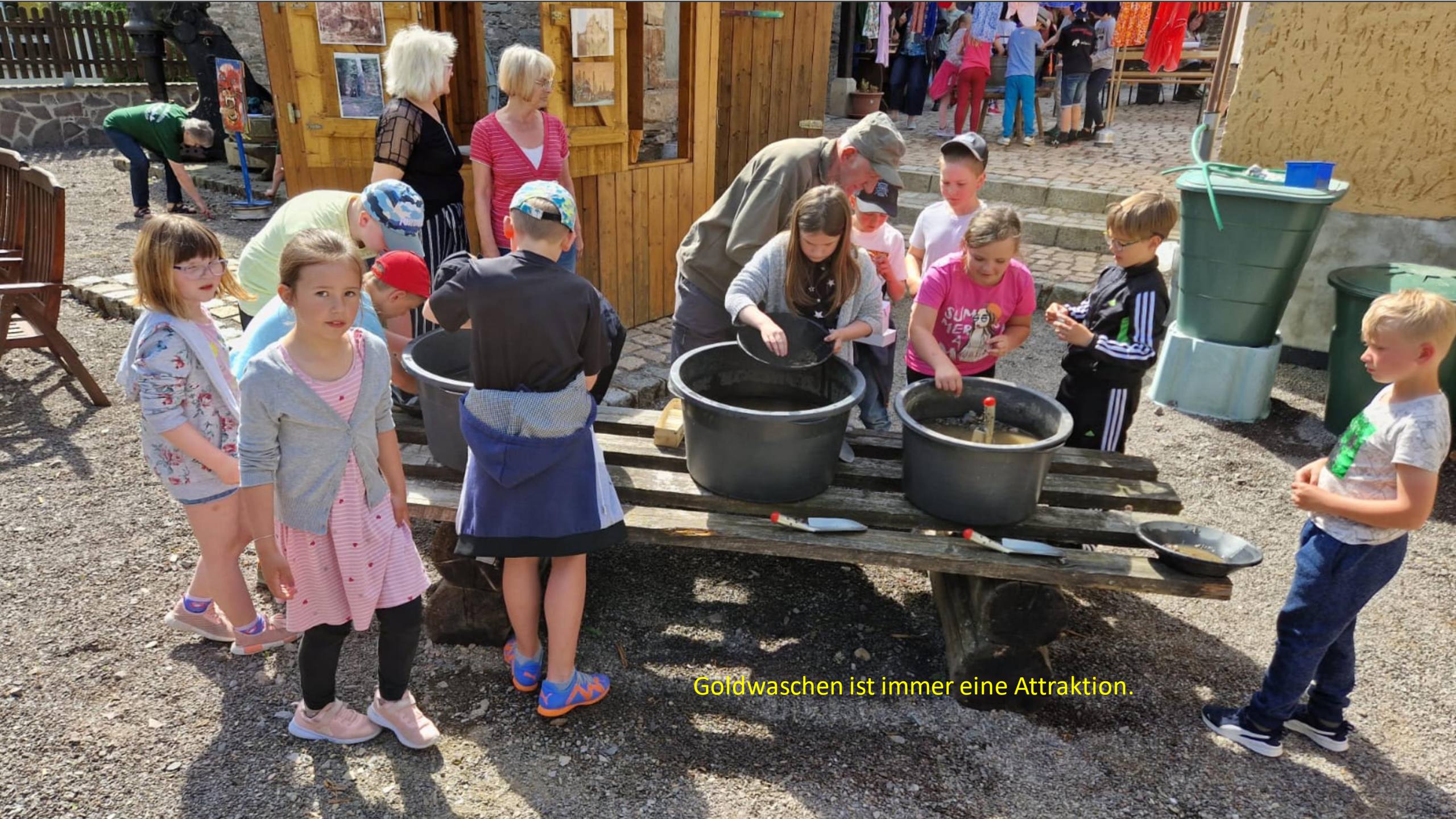
Goldwaschen ist immer eine Attraktion.