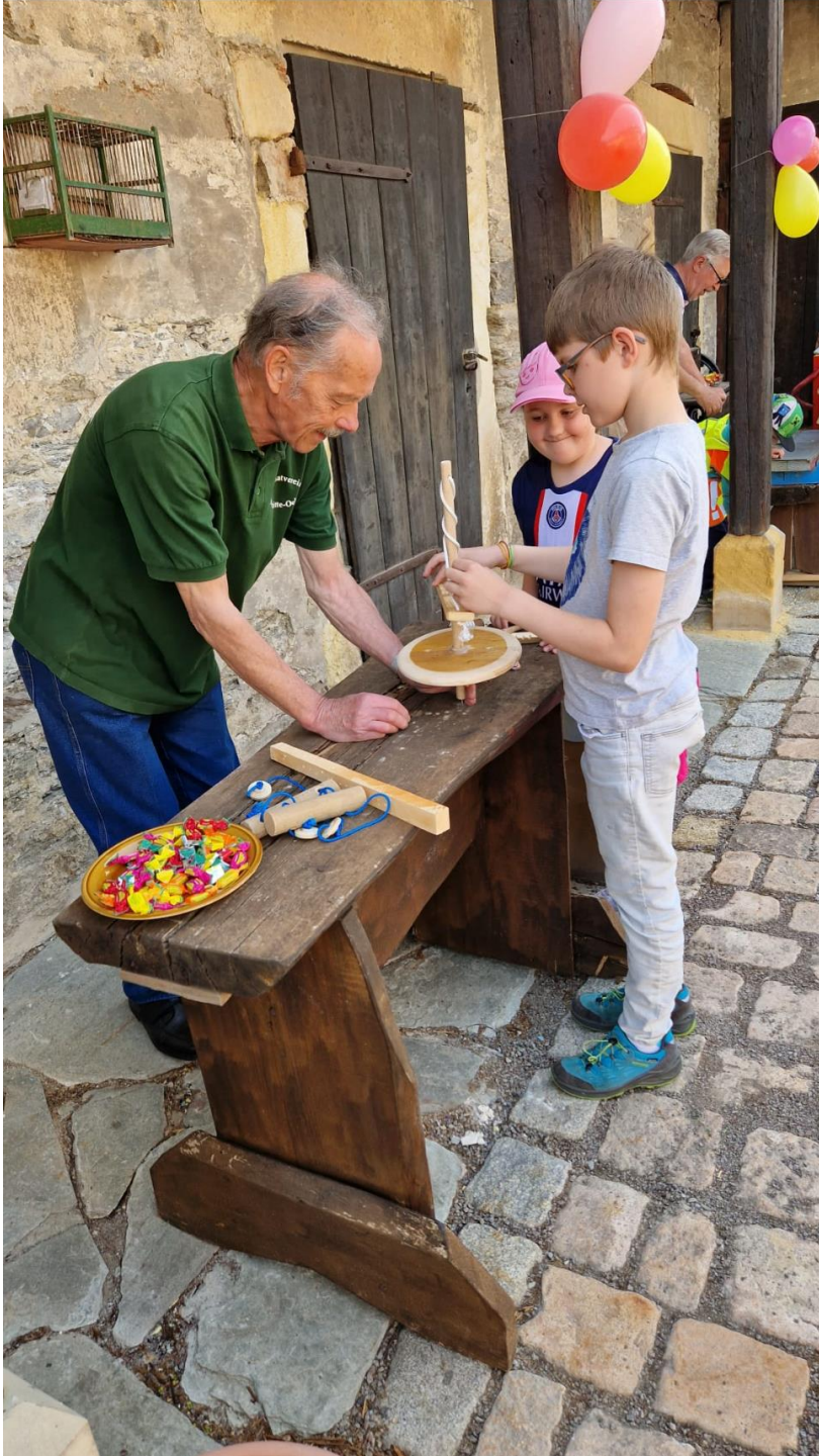
Holzbohrer, der mit Muskelkraft bewegt wird