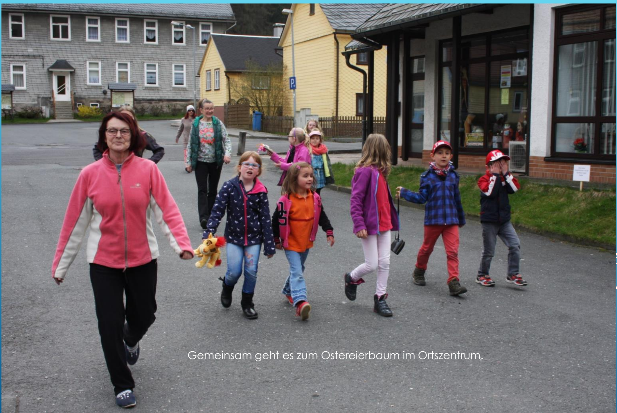
Gemeinsam geht es zum Ostereierbaum im Ortszentrum.