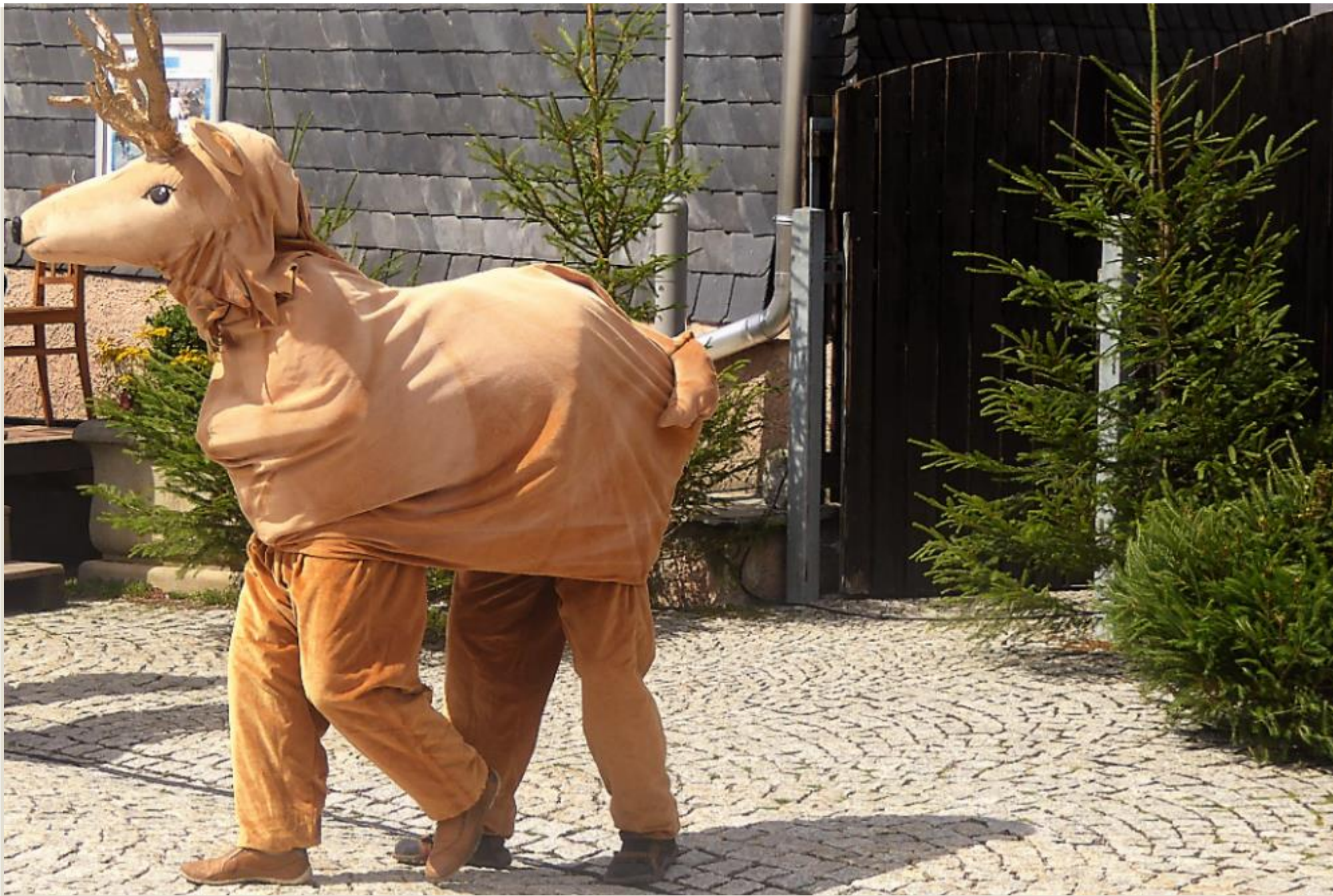
Der weiße Hirsch mit dem goldenen Geweih