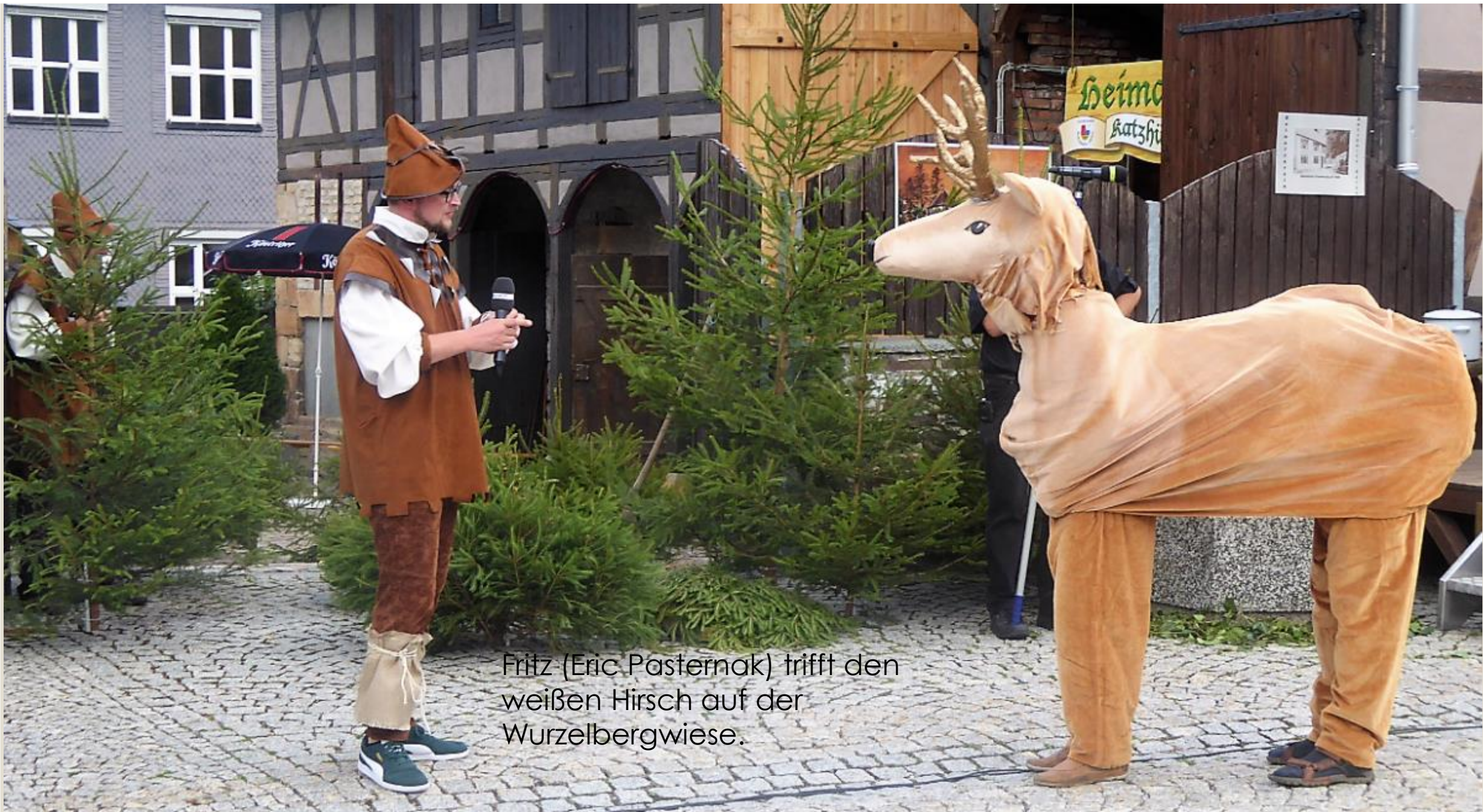
Fritz (Eric Pasternak) trifft den weißen Hirsch auf der Wurzelbergwiese.