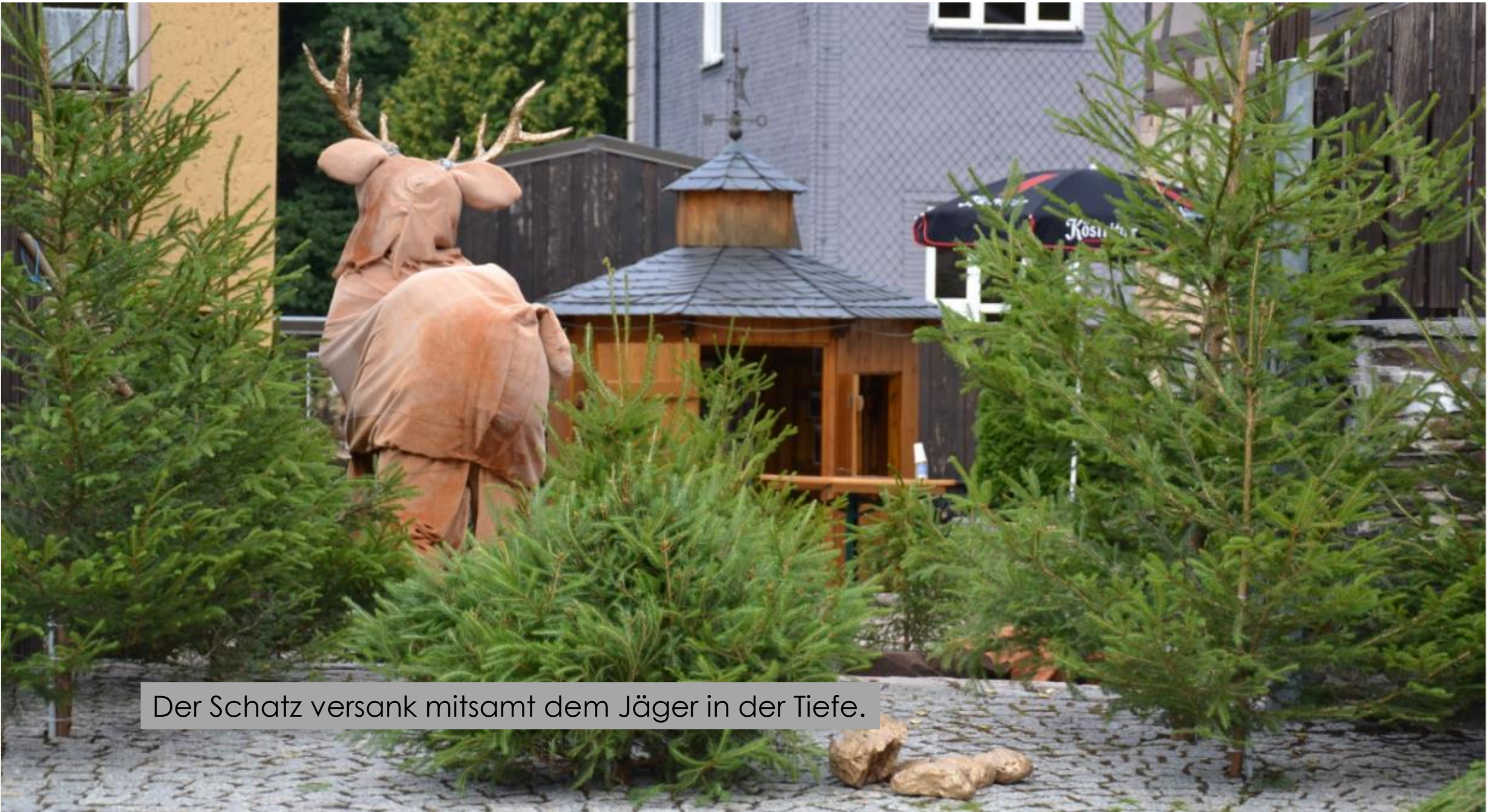
Der Schatz versank mitsamt dem Jäger in der Tiefe.