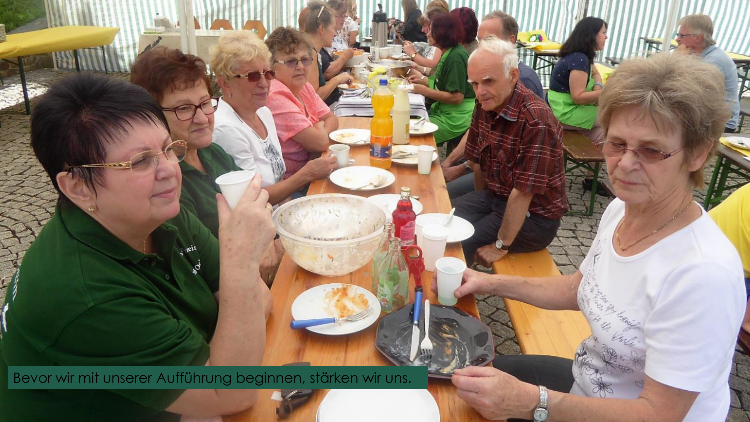
Bevor wir mit unserer Aufführung beginnen, stärken wir uns.