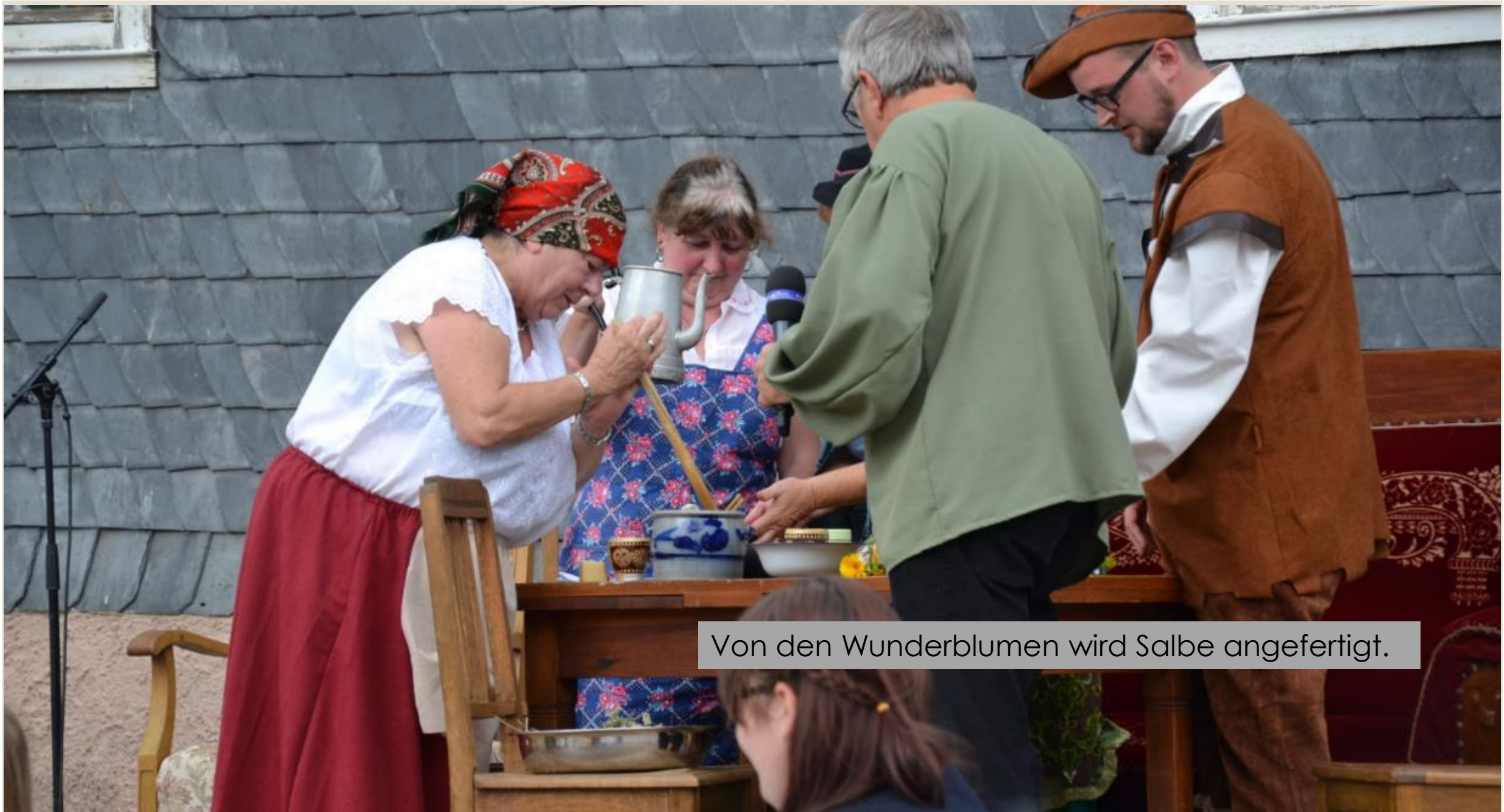
Von den Wunderblumen wird Salbe angefertigt.