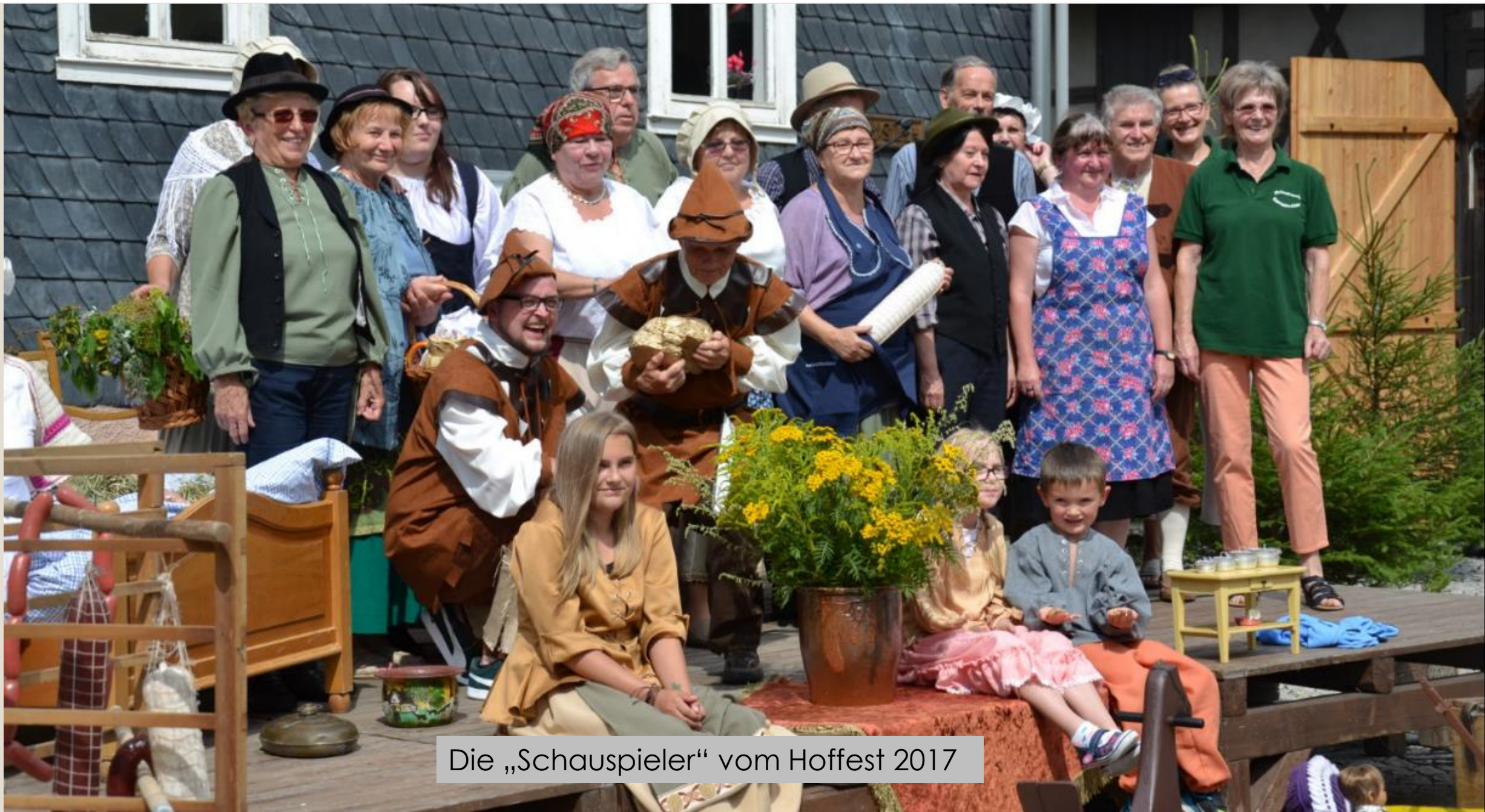
Die „Schauspieler“ vom Hoffest 2017