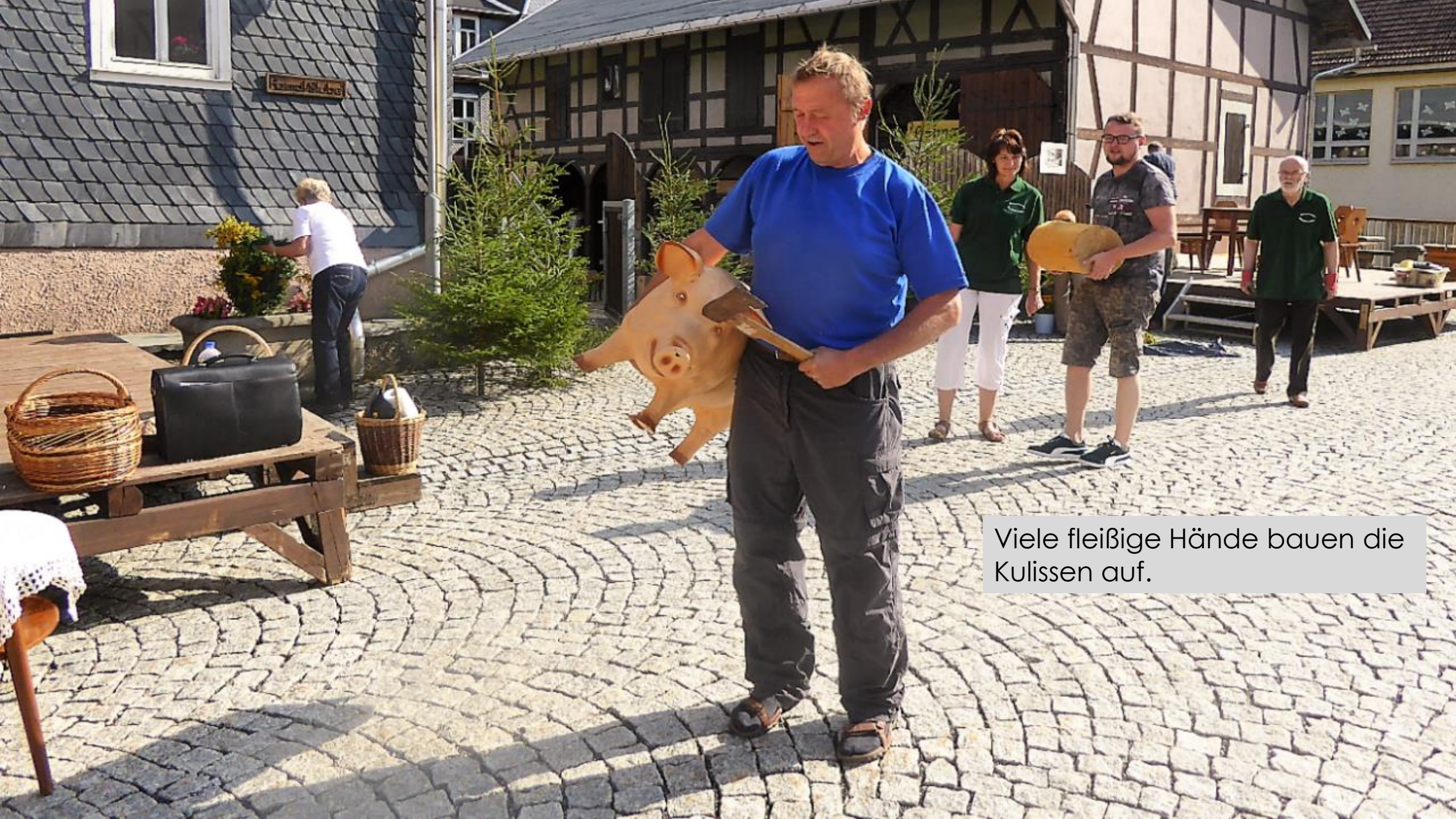
Viele fleißige Hände bauen die Kulissen auf.